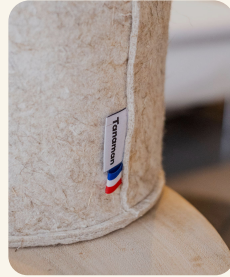
Unsere Töpfe aus recyceltem Stoff

Die Montage aller unserer Produkte erfolgt in unserer Werkstatt in Neuville-en-Ferrain, in der Nähe von Lille