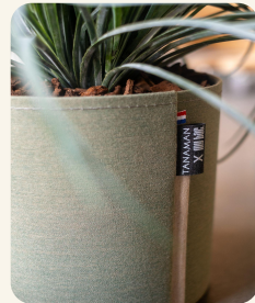
Unsere Töpfe aus Resten von nautischen Segeltuchen